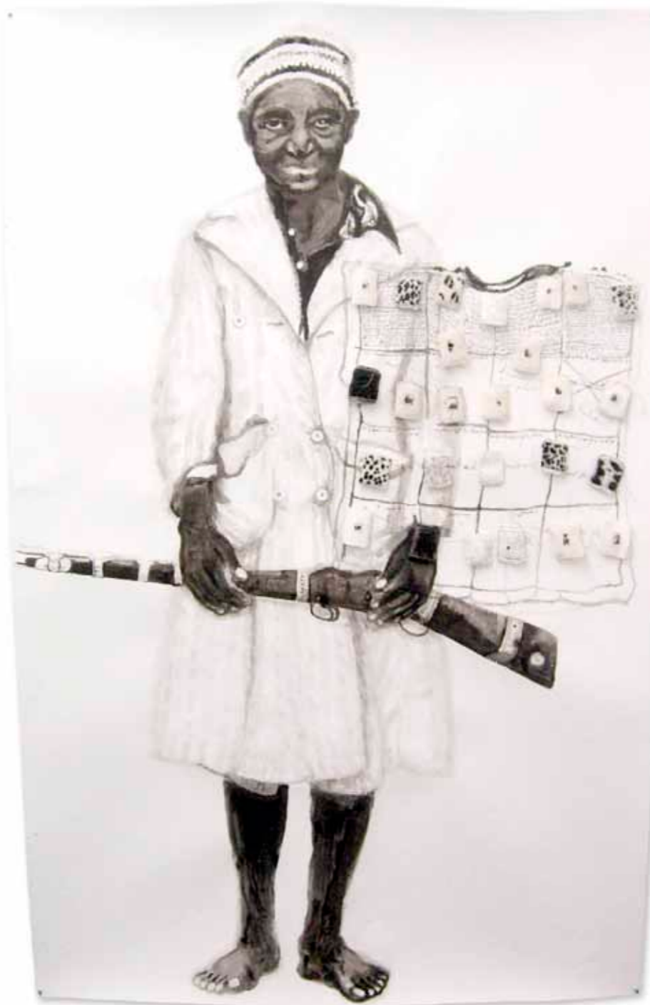
Merina Beekman Aan alles is gedacht, 2006 papier, fluweel, oi inkt, garen, potlood, acryl 205 x 130 cm