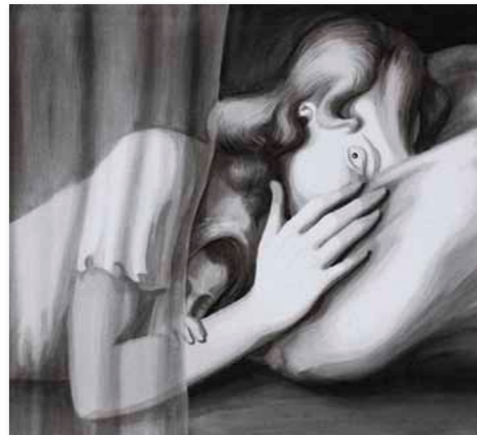
Marijn Akkermans All that no one sees, 2008 gemengde techniek op papier 96,5 x 105 cm