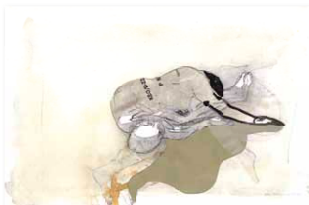
Caren van Herwaarden Du bist die Ruhe, 2007 gem techniek op papier 32,5 x 49,5 cm