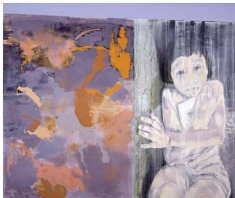
Rineke Marsman Zonder titel, 2007 olieverf op doek 130 x 150 cm

Ossip Robijn (variant C), 1992 foto, vernis, grafiet en viltstift 138 x 121 cm