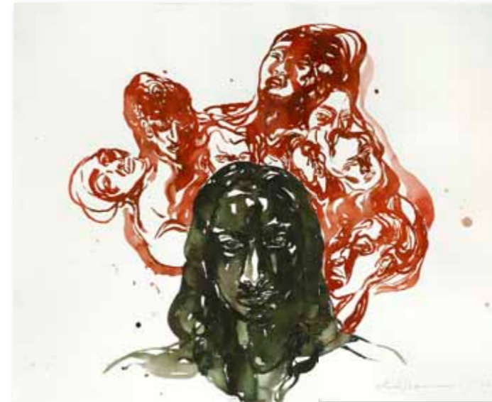
Aline Thomassen Zonder titel, 2009 aquarelverf op papier 94 x 115 cm