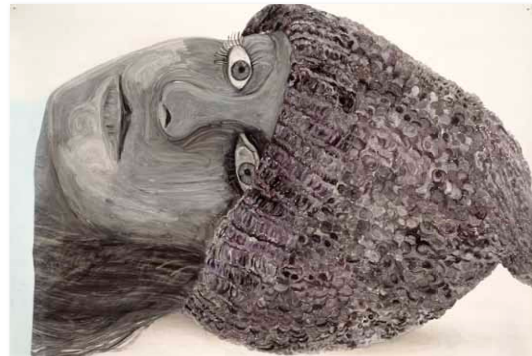
Elly Strik Muts van Monet, 2000/06 lak en olieverf op papier 205 x 295 cm